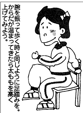
腕を振って歩く時と同じように足踏みを。からだを温まってきたら太ももを高く上げてみよう。

「まずは、1日10分の運動から始めましょう。平日は、室内でチェアウォーキング。週末は、外でのウォーキングを楽しむなど工夫して、日ごろの生活に上手に運動を取り入れてほしい」と黒田さんは話す。