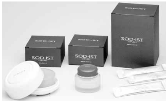
[当商品には合成着色料・合成保存料は使用していません]

SOD-IST (ソディスト) は丹羽療法における疾病治療・予防を目的とした患者さんや愛用者の方々の体験から生まれました。まさに治療が偶然見つけた素肌への贈り物です。SOD様ナチュラルフーズ・SOD様ナチュラルクリーム・天然の低刺激粹練石鹸の組合せにより“体の内部・外部から美を養う”をコンセプトに誕生したのが丹羽SOD美容法[SOD-IST]です。