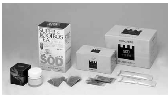
[当商品には合成着色料・合成保存料は使用していません]

丹羽博士が長年をかけて研究・開発し、多くの学会や研究機関で臨床成績が確認されているSODロイヤル(丹羽SOD様食品)を始めとする、活性酸素を除去するルイボスTX、スーパールイボスティ、SODクリームなどは、下記の取扱店でお求めになれます。