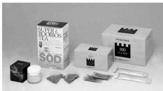
[当商品には合成着色料・合成保存料は使用していません]

丹羽博士が長年をかけて研究・開発し、多くの学会や研究機関で臨床成績が確認されているSODロイヤル(丹羽SOD様食品)を始めとする、活性酸素を除去するルイボスTX、スーパールイボスティー、SODクリームなどは、下記の取扱店でお求めになれます。