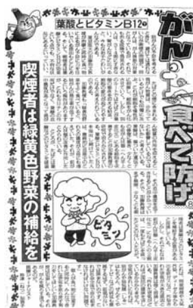
本文は、「癌」食べて治せ（日刊スポーツ・No 06・07・08）から、抜粋・引用しました。

れいになれば、肺癌や肺気腫はもちろん、喘息やアトピーなどの病気も激減するはず。証拠がないでは済まないのです。これは、社会全体で取り組まなければいけない問題です。」