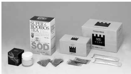
[当商品には合成着色料・合成保存料は使用していません]

丹羽博士が長年をかけて研究・開発し、多くの学会や研究機関で臨床成績が確認されているSODロイヤル(丹羽SOD様食品)を始めとする、活性酸素を除去するルイボスTX、スーパールイボスティ、SODクリームなどは、下記の取扱店でお求めになれます。