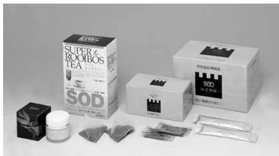
[当商品には合成着色料・合成保存料は使用していません]

丹羽博士が長年をかけて研究・開発し、多くの学会や研究機関で臨床成績が確認されているSODロイヤル(丹羽SOD様食品)を始めとする、活性酸素を除去するルイボスTX、スーパールイボスティ、SODクリームなどは、下記の取扱店でお求めになれます。